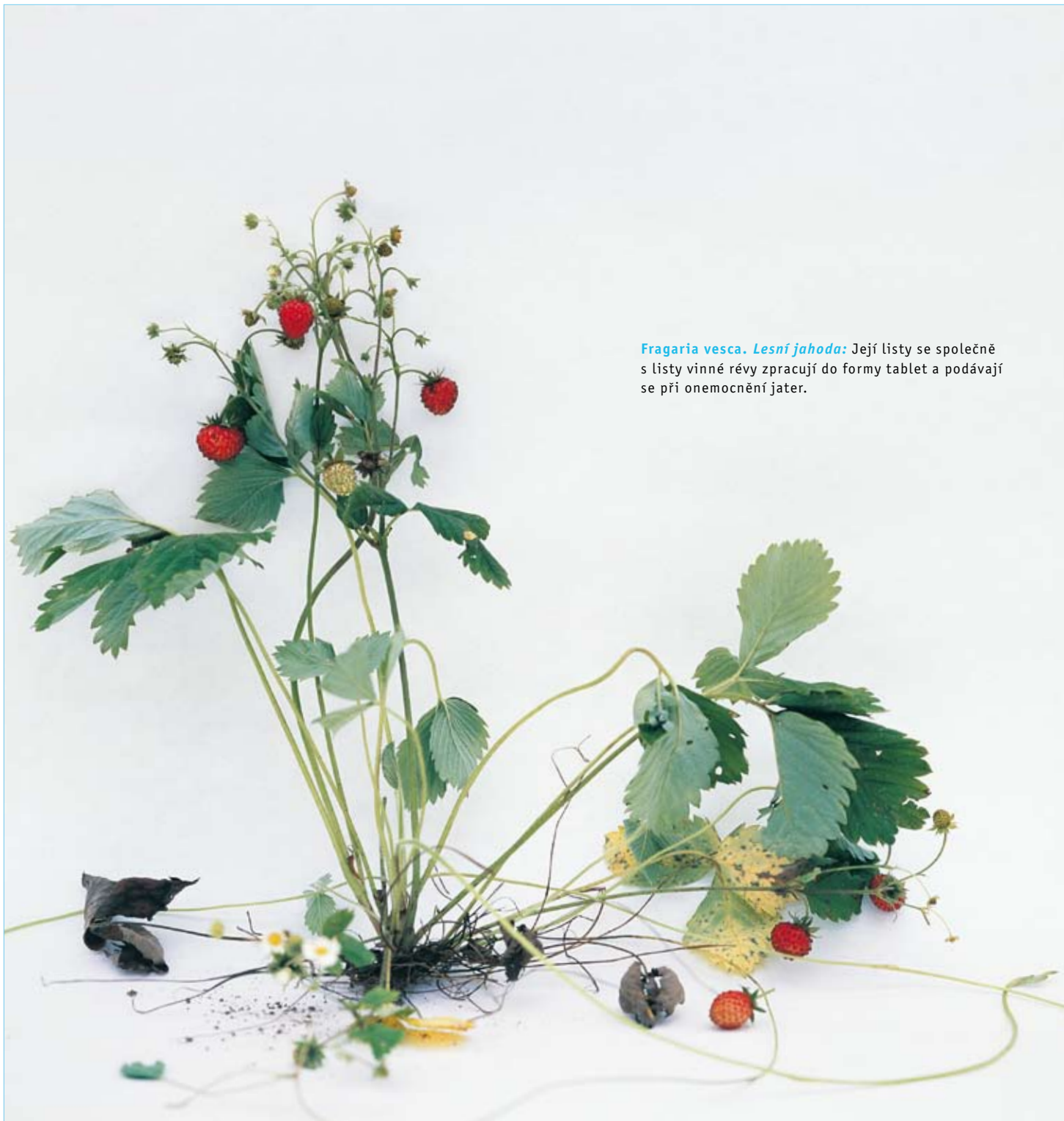
Fragaria vesca. Lesní jahoda: Její listy se společně s listy vinné révy zpracují do formy tablet a podávají se při onemocnění jater.