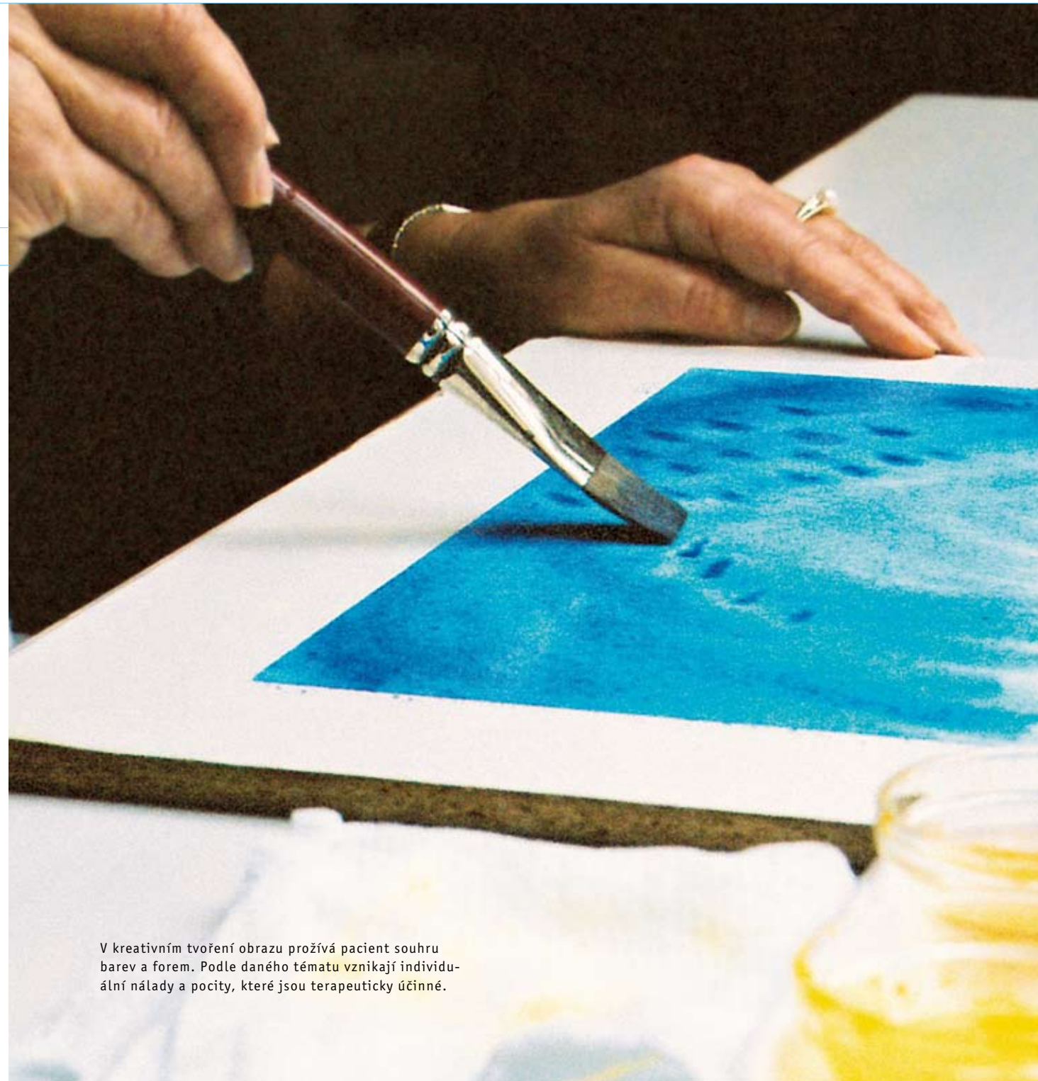
V kreativním tvoření obrazu prožívá pacient souhru barev a forem. Podle daného tématu vznikají individuální nálady a pocity, které jsou terapeuticky účinné.

Již v roce 1921 vznikly v Arlesheimu u Basileje (Švýcarsko) a ve Stuttgartu (Německo) první, tenkrát ještě velmi skromné, kliniky, ve kterých se nový lékařský způsob uváděl