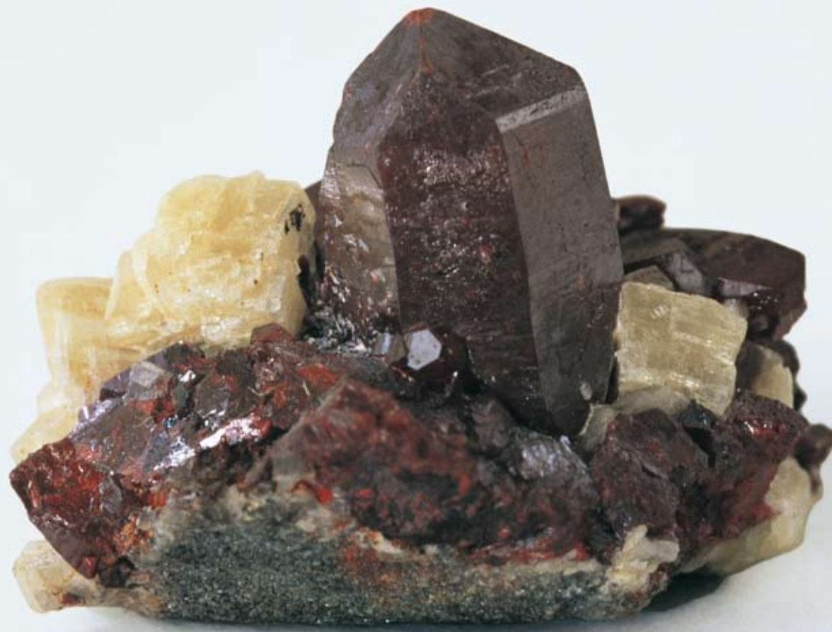
Rumělka. Minerál, který se používá jako prášek v tabletách, jež se užívají při akutních a chronických zánětech horních cest dýchacích.

Mimo to se používají i prostředky, které jsou komponovány pro specifická onemocnění, jejichž složení se orientuje podle zákonitostí vládnoucích v určitém onemocnění. K těm patří přípravky z rostlin, ale i léčiva minerálního nebo živočišného původu. Jaké prostředky lékař zvolí, ať už jako extrakt