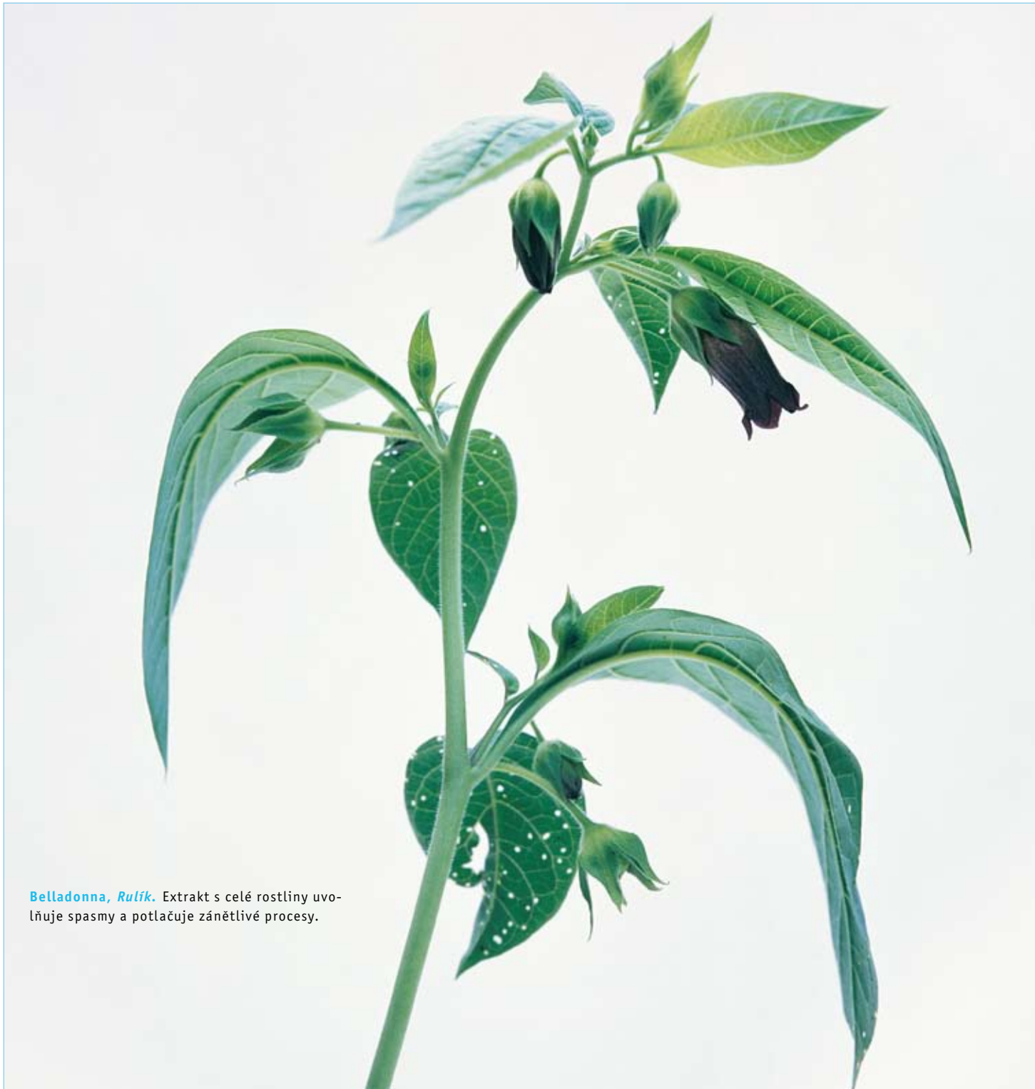
Belladonna, Rulík. Extrakt s celé rostliny uvolňuje spasmy a potlačuje zánětlivé procesy.