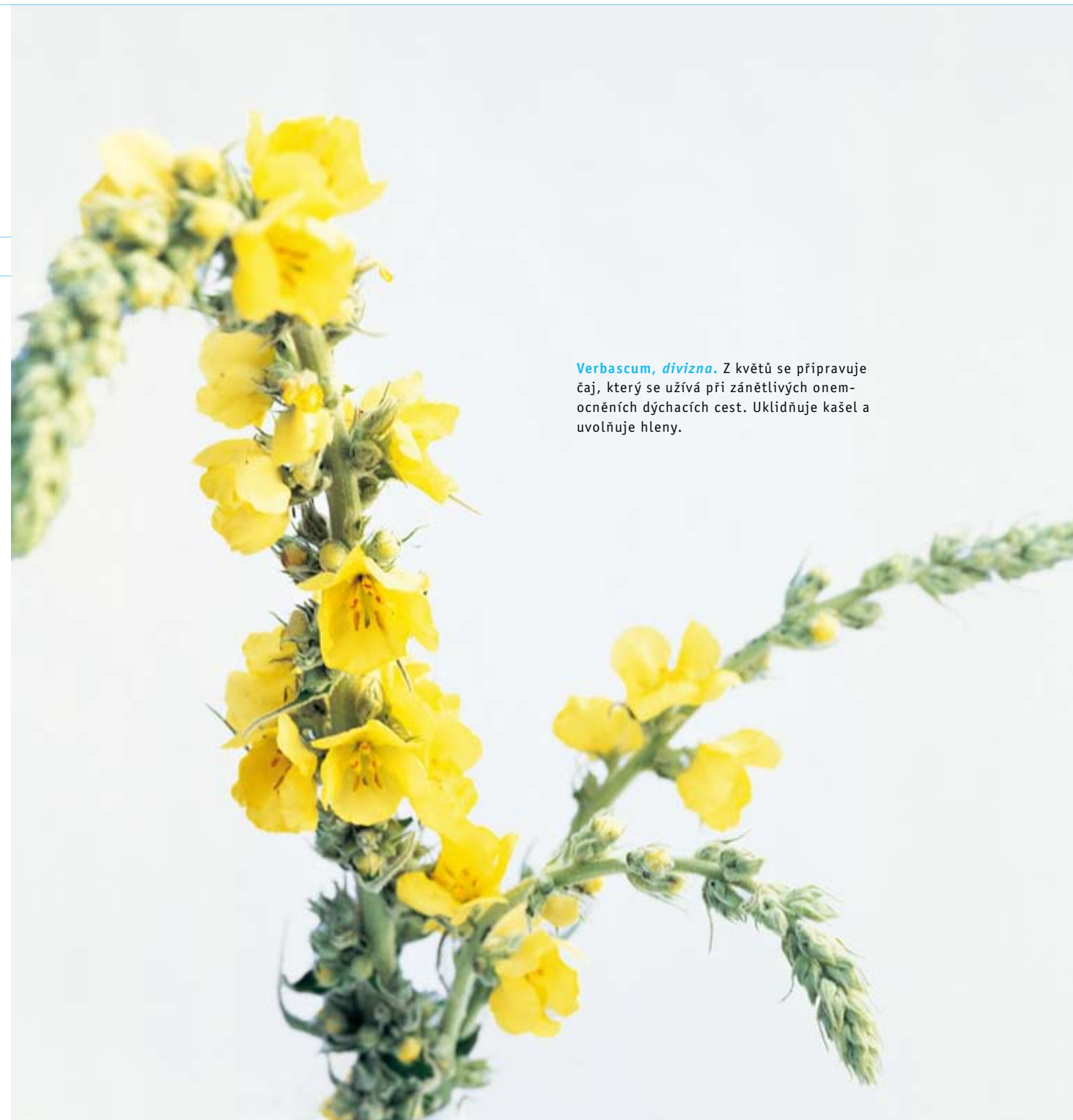
Verbascum, divizna. Z květů se připravuje čaj, který se užívá při zánětlivých onemocněních dýchacích cest. Uklidňuje kašel a uvolňuje hleny.

Nemocí se dostává člověku možnost, rozpoznat narušenou rovnováhu, ze které se tělem i duší vychýlil. Dostává šanci pochopit výchylku a pomocí terapie najít opět novou rovnováhu, často na vyšší úrovni. Chronické onemocnění mu nabízí možnost, naučit se nové schopnosti, nové způsoby jednání a dává naší osobnosti možnost zrát. Antroposofický lékař podporuje svého pacienta právě tímto směrem. Posiluje jeho zodpovědnost za sebe, uznává jeho svéprávnost, podporuje jeho právo na rozhodování při volbě terapie, a posiluje ho v jeho snaze udržet si své zdraví.