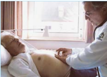
Při prohmatání břicha (vlevo) jsou zjištěné nálezy ověřeny pomocí vyšetření ultrazvukem (vpravo) a doplňovány.